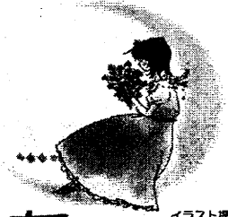
イラスト提供： ふわり。